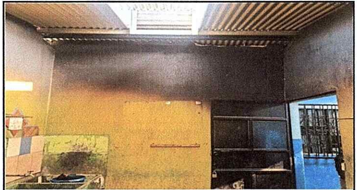
Foto 4: Interior de la cocina, pared en mal estado por el ahumado del polletón.