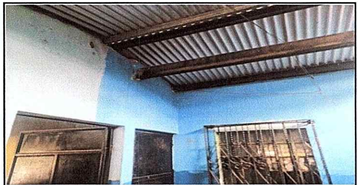
Foto 6: Ingreso a la cocina, problemas con la apertura de las puertas.

Observación: Si es necesario se pueden agregar hojas adicionales y actualizar el número de hojas.