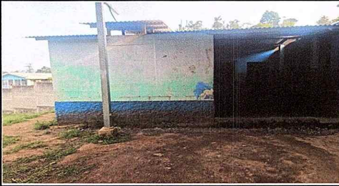
Foto 1: Fachada lateral (Hacia el corredor) de la cocina a remozar.